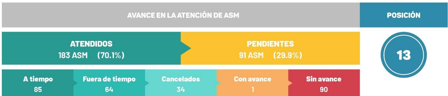
Estatus de atención de los ASM por intervención pública, SEGEY.